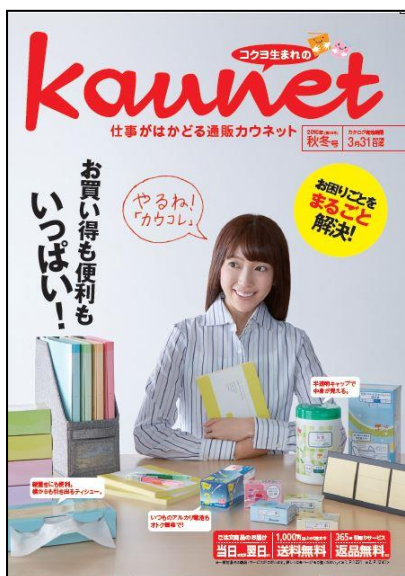
カウネットカタログ2016年秋冬号