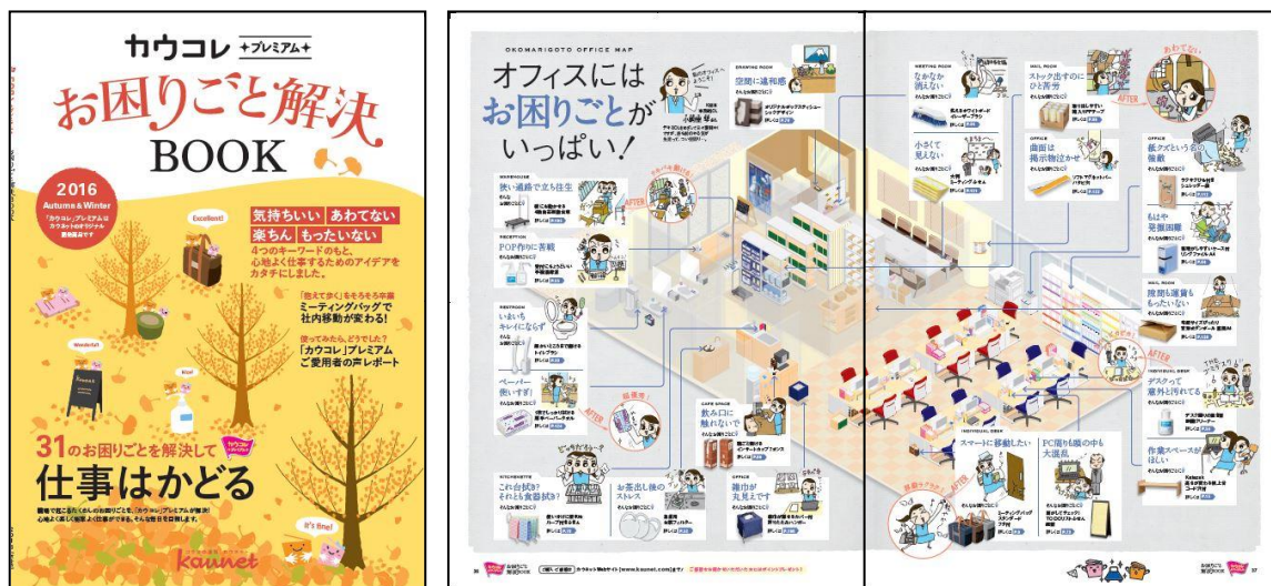
左: お困りごとと解決BOOK2016年秋冬号 表紙

当カタログ発刊と同時に、「カウネットカタログ2016年秋冬号」、「カウネット家具カタログ2016年秋冬号」、も発売します。両カタログについてはプレスリリース「カウネットカタログ2016年秋冬号(第32号)を発売」、「カウネットカタログ2016年秋冬号を発売」をご覧ください。