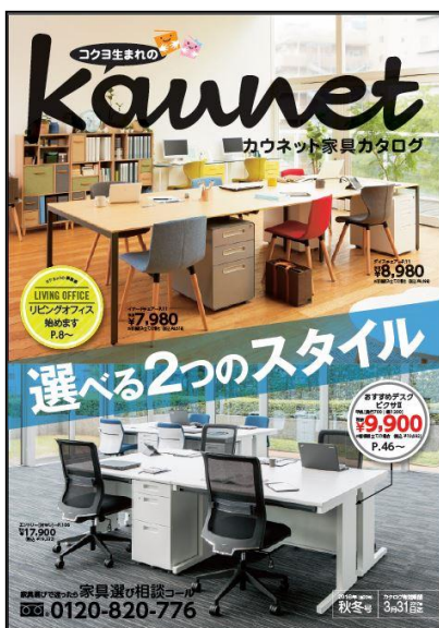
カウネット家具カタログ2016年秋冬号