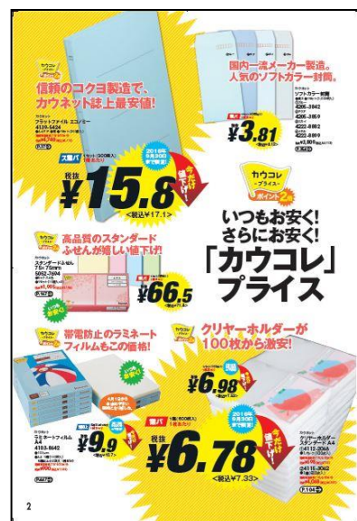
左:カウネットカタログ2016年秋冬号(第32号)表紙 中:9月実施予定の「カウコレ」プレミアム期間限定キャンペーンページ 右:「カウコレ」プライス特集ページ