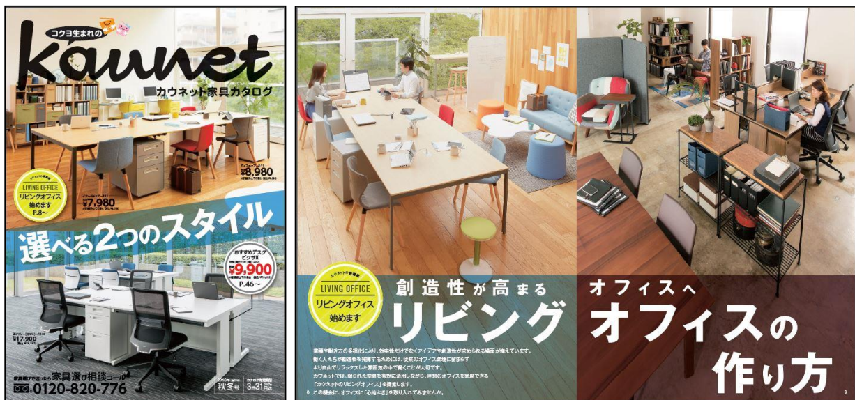
左:カウネット家具カタログ2016年秋冬号 表紙

当カタログ発刊と同時に、「カウネットカタログ2016年秋冬号」、「カウコレ」プレミアムだけを掲載し、お客様のお困りごと解決に徹底的にこだわった「お困りごと解決BOOK2016年秋冬号」も発刊します。両カタログについてはプレスリリース「カウネットカタログ2016年秋冬号(第32号)を発刊」、「お困りごと解決BOOK2016年秋冬号を発刊」をご覧ください。