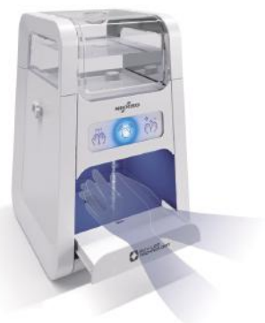
Automatic Hand Soap Dispenser