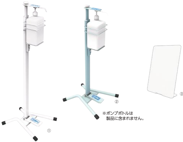
※ポンプボトルは製品に含まれません。