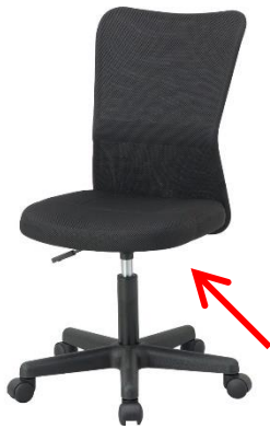
座面の裏側のシートプレート