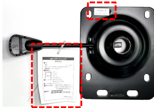
シートプレートに「品質表示タグ」と「FRONT シール」あり