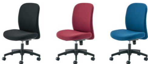
ブラック ワインレッド ブルー