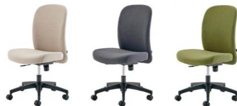
ベージュ グレー グリーン